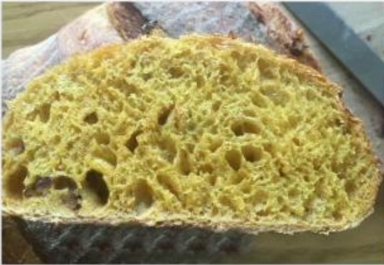
using baking pizza stone