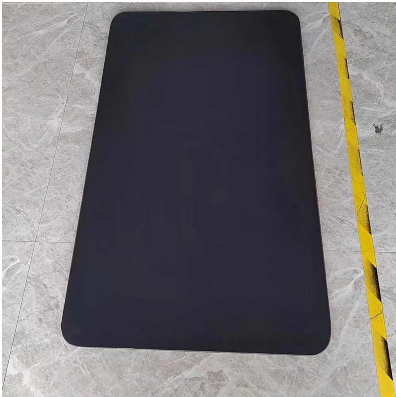
Non Stick Flat Baking Sheet (Front Side)