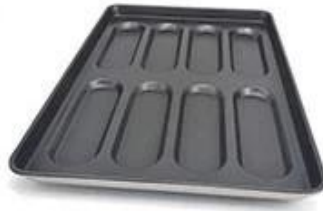
hot dog bun pan