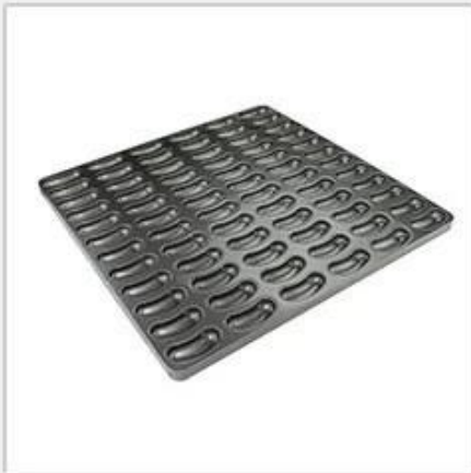
hot dog moulds