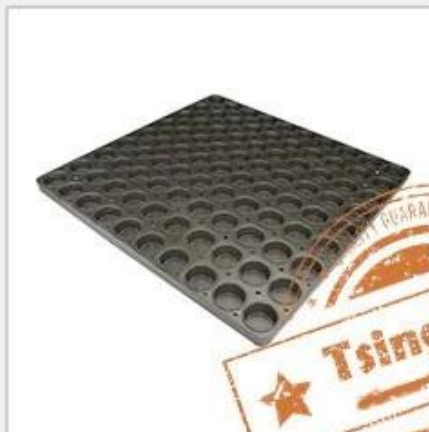
holes for air flow