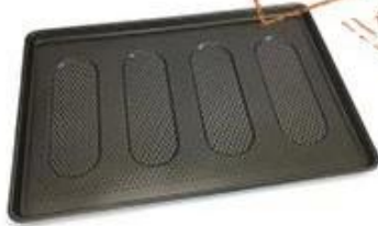
perforated & oval