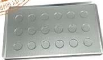
perforated tart mould