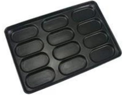
custom mould size