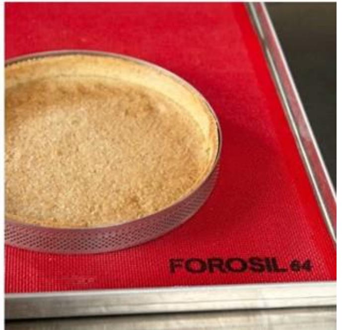
Produits Photos :