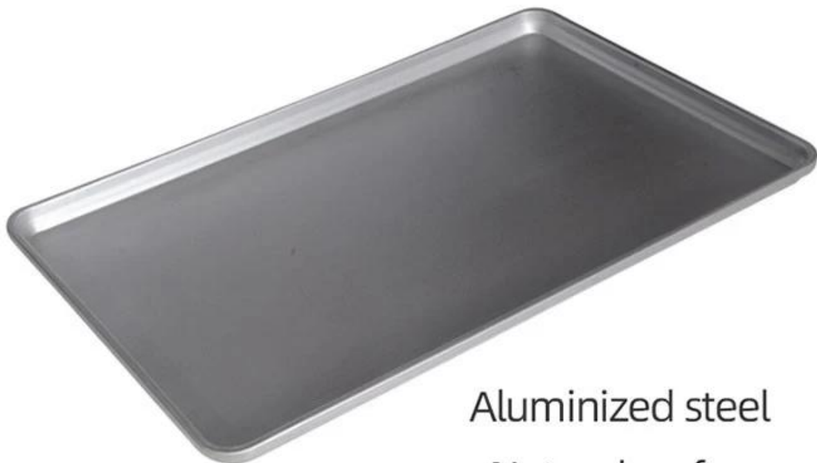
Aluminized steel Natural surface