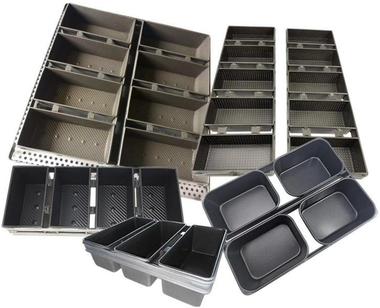
Photos de l'usine de pain et de moules à pain Tsingbuy