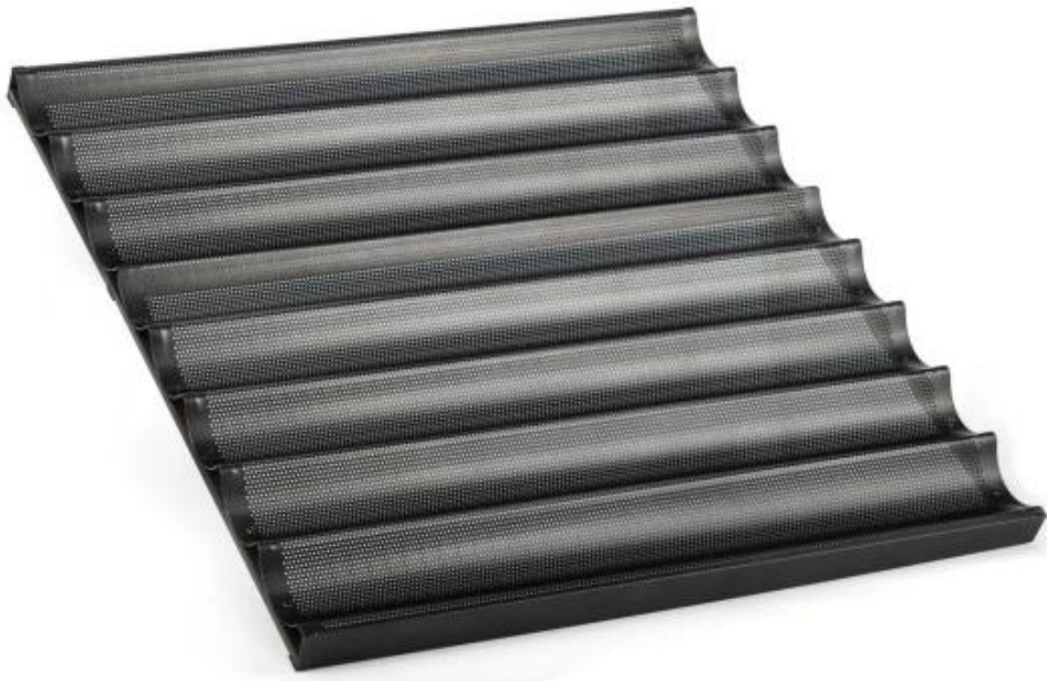
Détails de Plateau de cuisson à la baguette française de 7 rangées personnalisée.