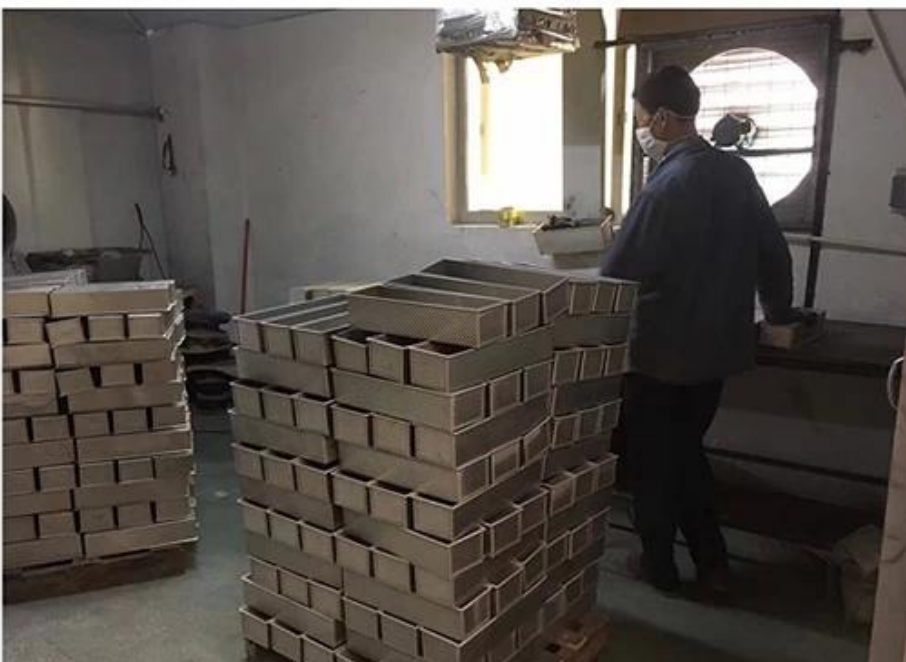
Salle d'exposition de nos moules à pâtisserie