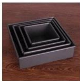
Hard non stick