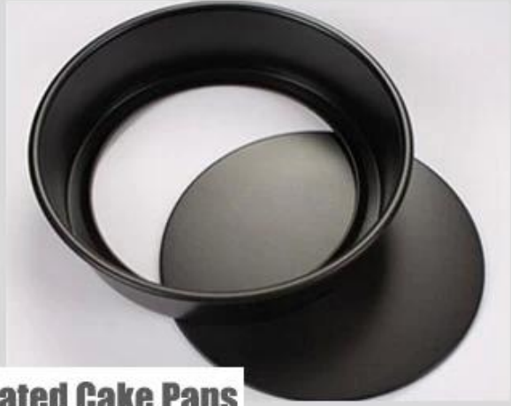
Non-stick Coated Cake Pans