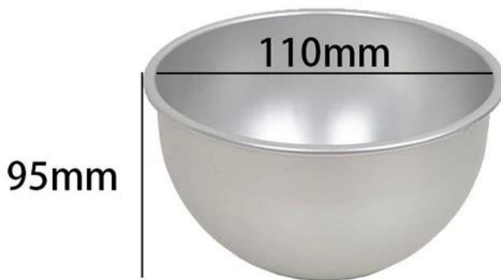
4 inch deep half ball mold