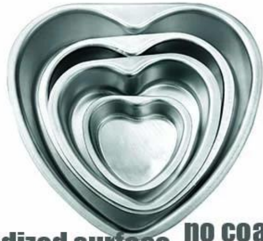
anodized surface no coating