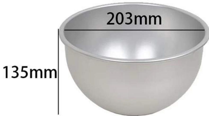
8 inch deep half ball mold