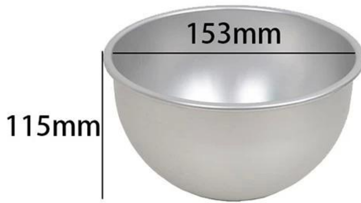
6 inch deep half ball mold