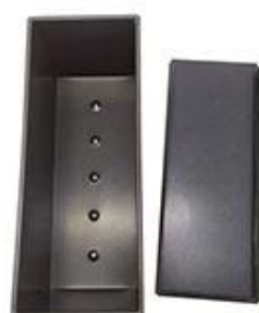
holes at bottom