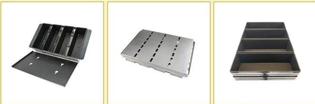
with buckled lid