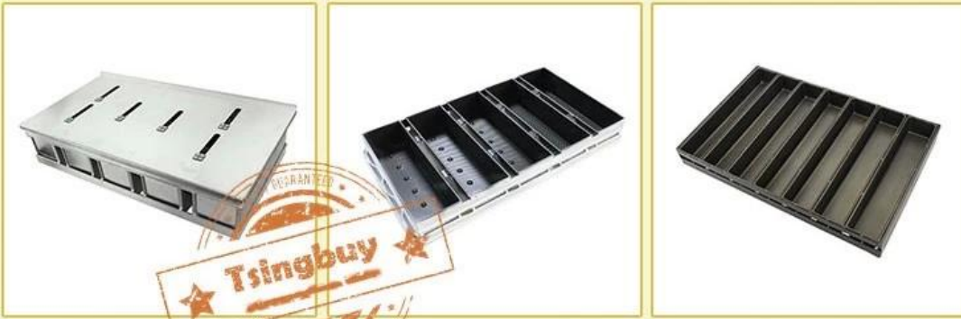
4/5 straps with lid

Available for food factory machinery lines