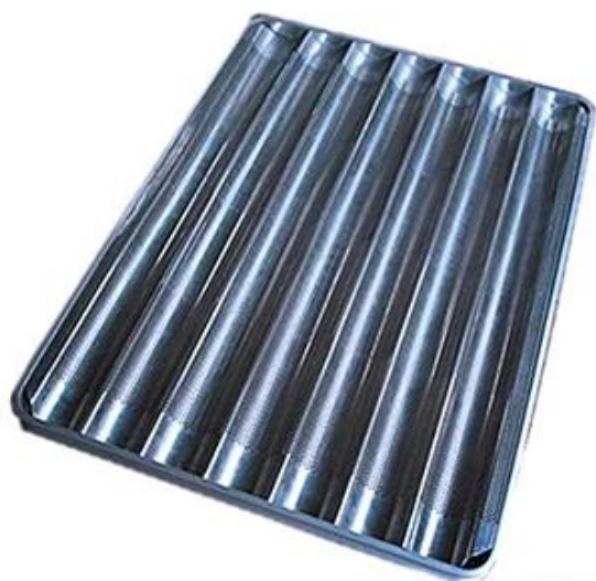
7 baguettes round corner