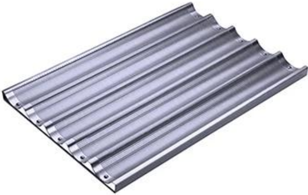
5 baguettes open frame