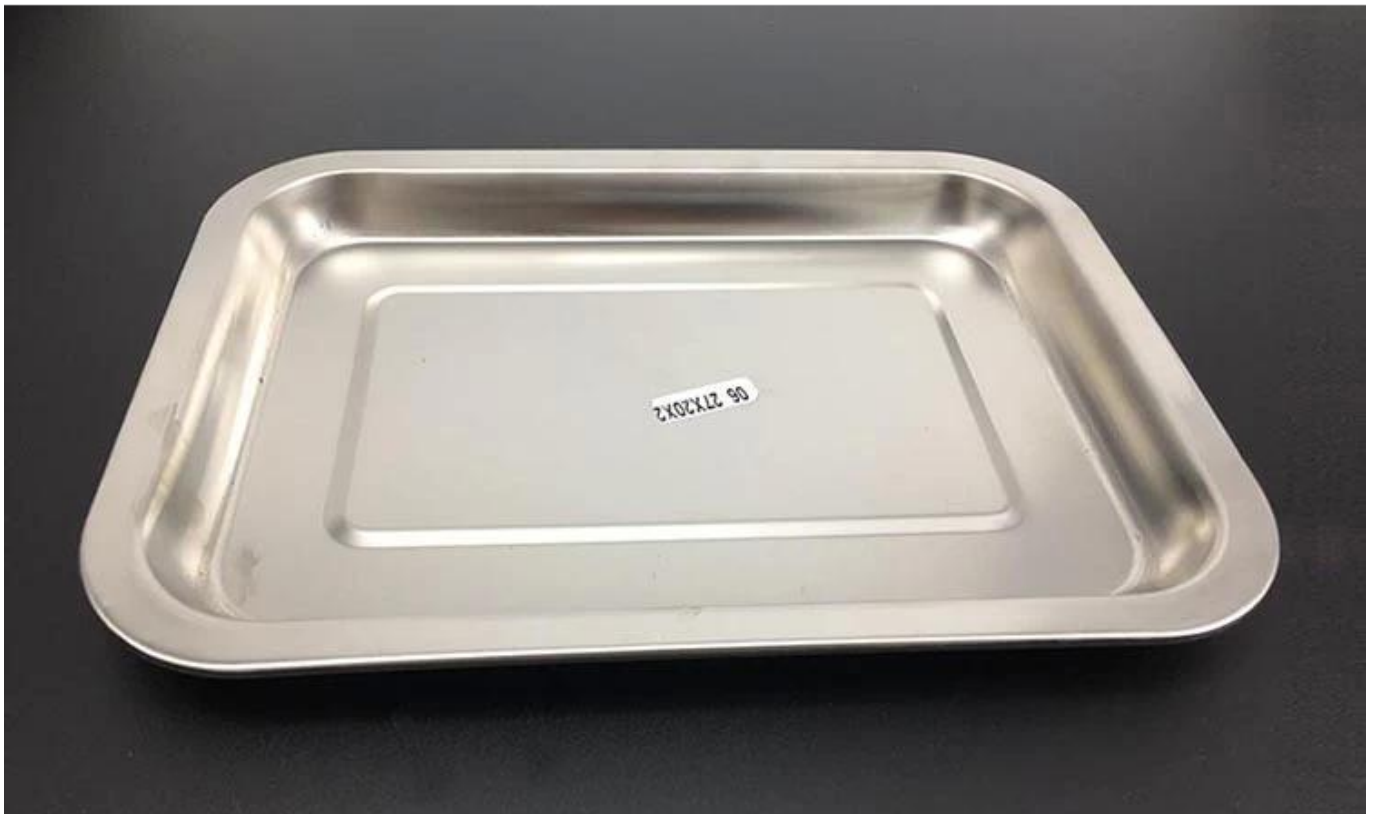
Image Plateau en acier inoxydable 304

La conception du curling est adoptée pour les coins, ce qui est doux, évitant les coupures à la main et plus pratique. Des bacs de même taille peuvent être empilés, économisant de l'espace