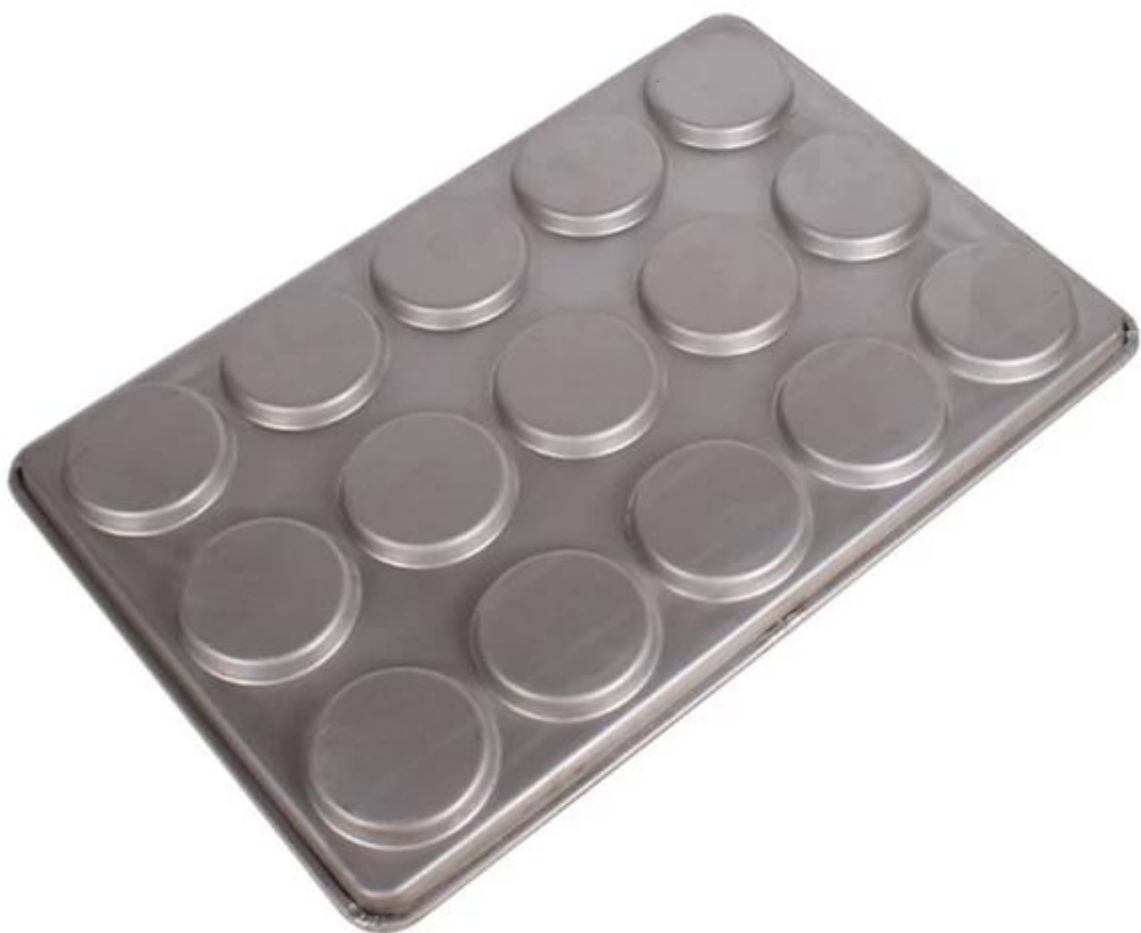
Personnalisation du plateau de coupe OEM du fabricant de poêles multi-moules en Chine