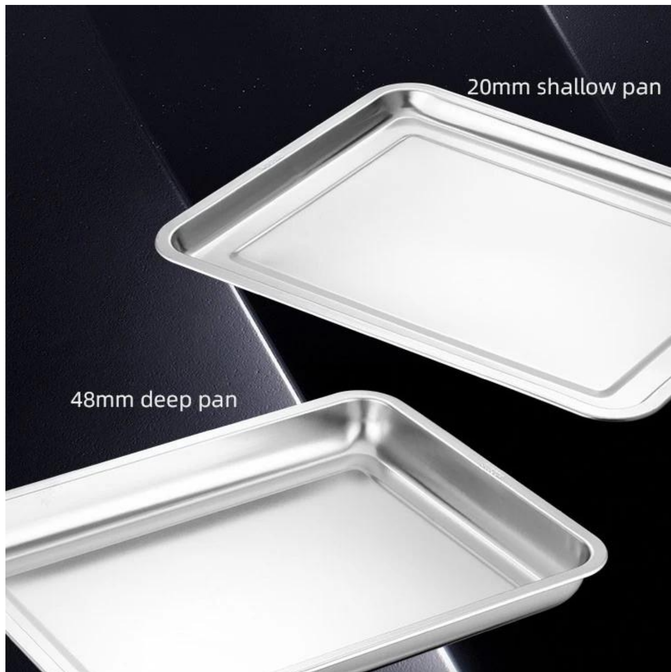
Image s de Plaque de cuisson en acier inoxydable 304 Plateaux de cuisson Plateau de nourriture de restaurant