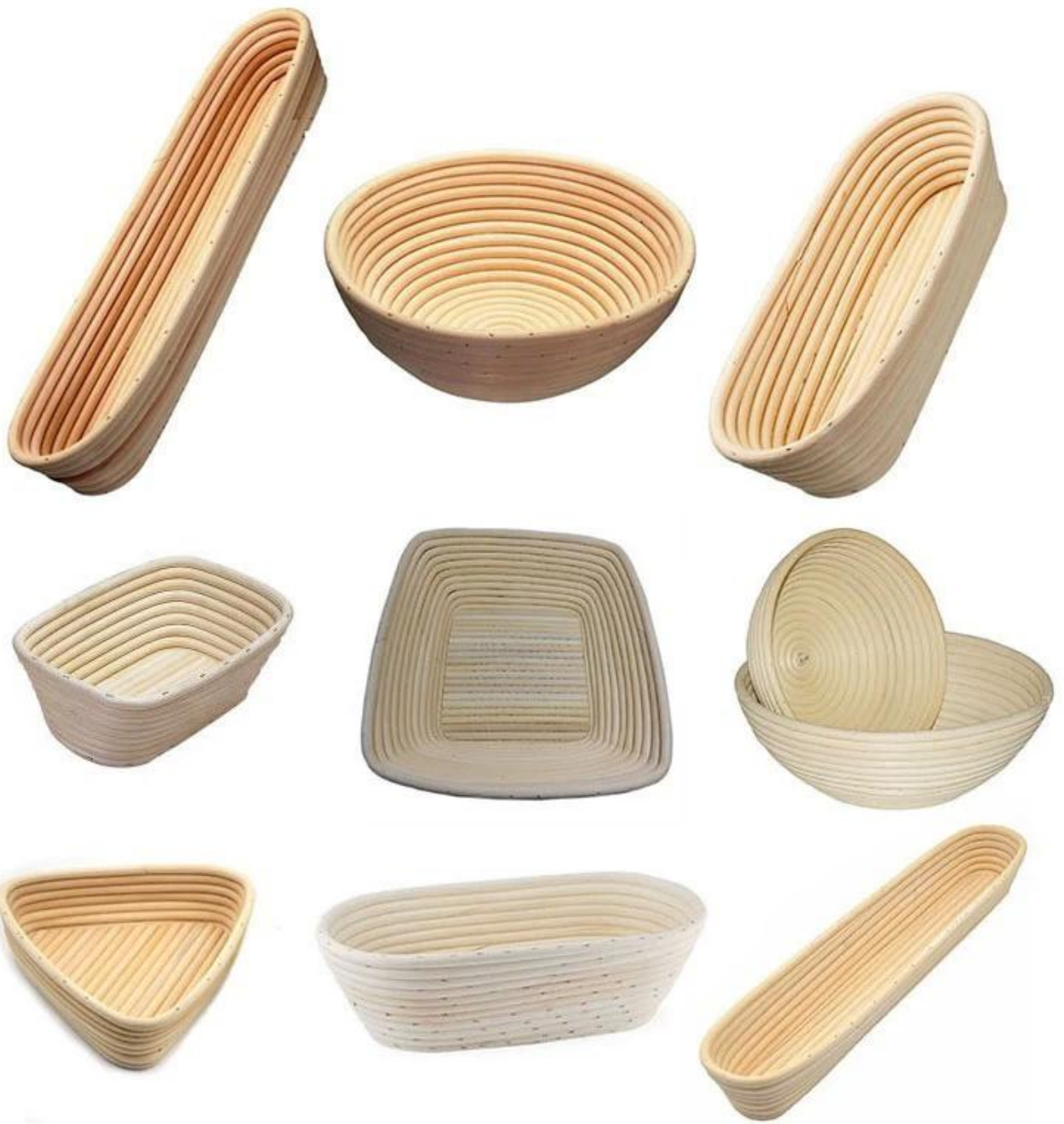
Photos de l'usine de paniers Banneton