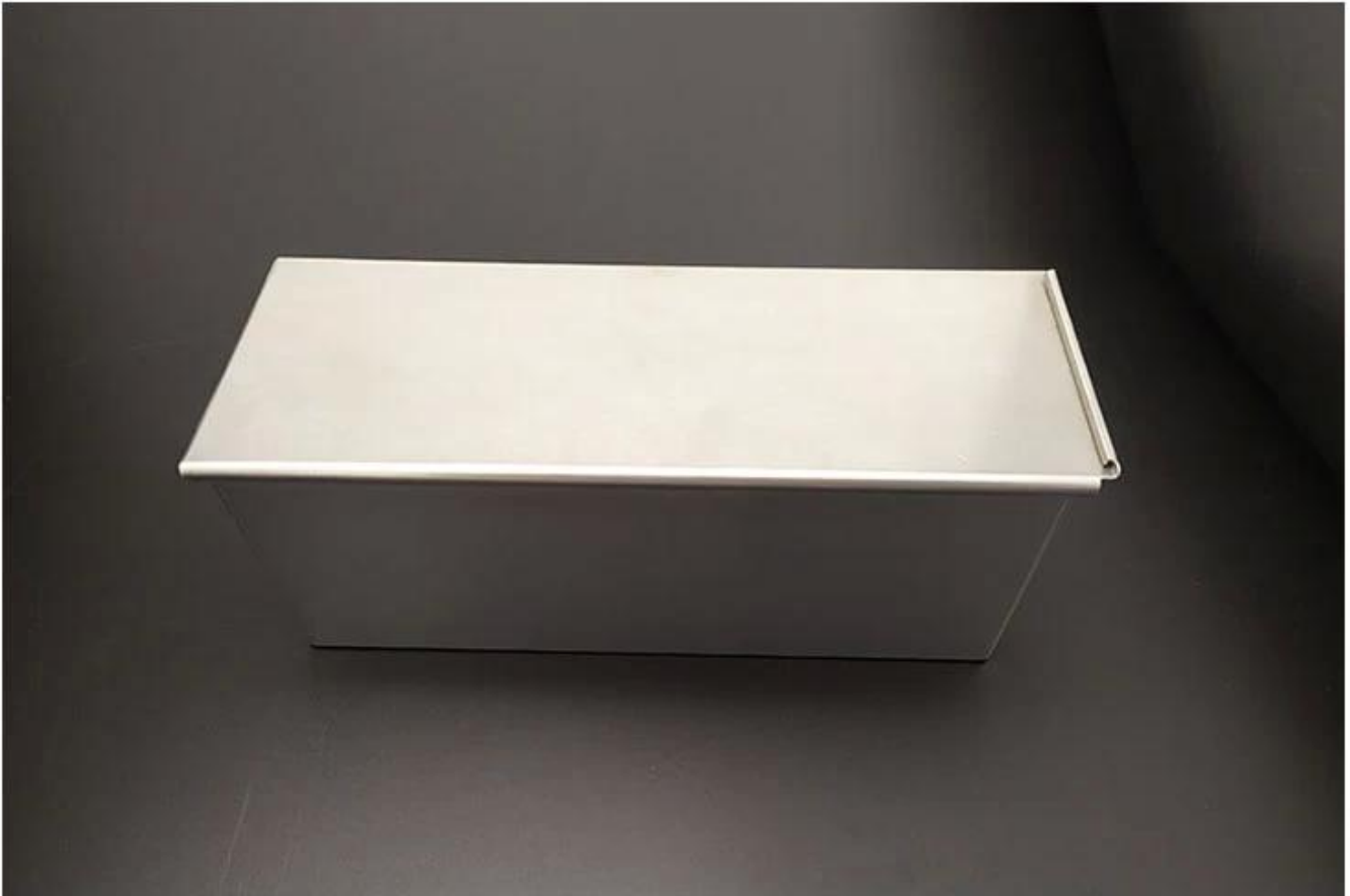
Image du produit de 1500 aluminium antiadhésif moule à pain avec un couvercle