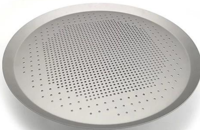
Imagen del productos de cacerola de pizza perforada de aluminio