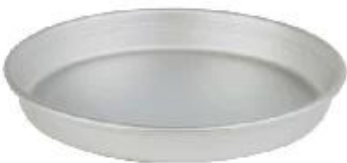
anodized aluminum alloy pizza pan