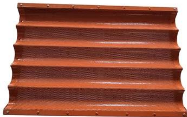
Rubber Silicone Coated Standard Size