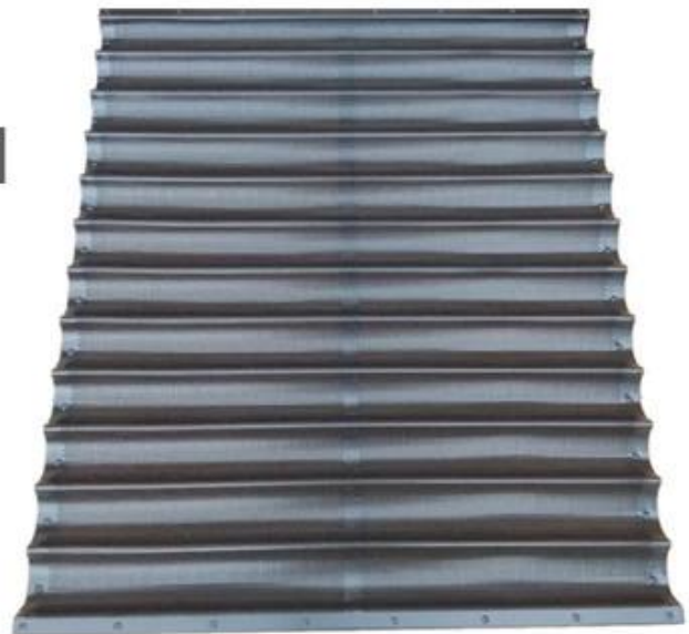
custom manufactured 12 rows Large baguette pan