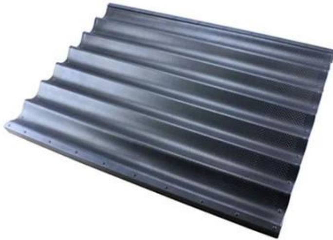
7 rows Silicone coated