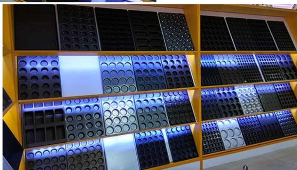
Multi-Mold Baking Tray