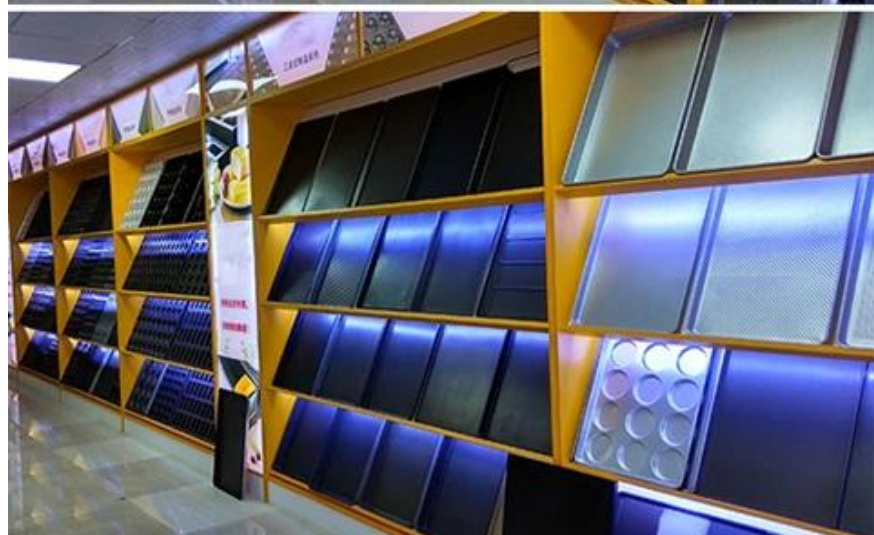
Sheet pan Drying pan