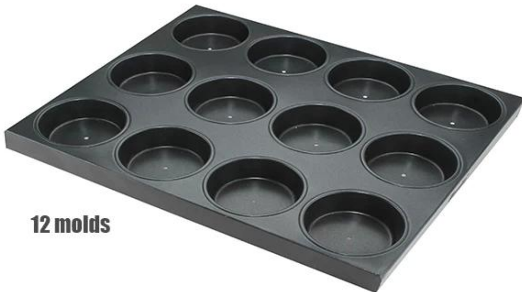
Imagen del productos de acero aluminizado Molde redondo grande para hornear panecillos