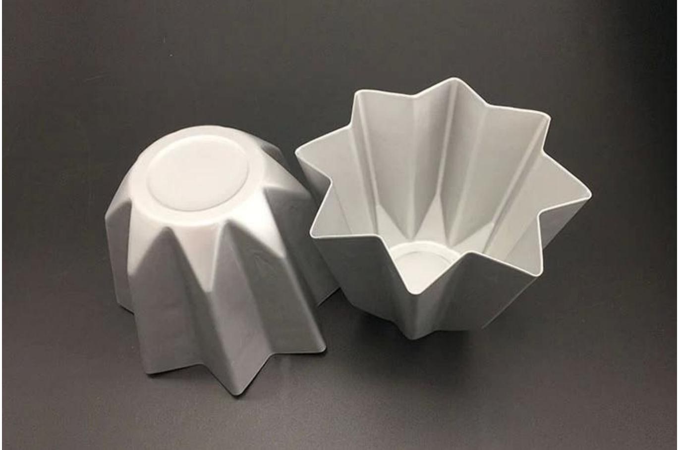
Imagen del productoS del molde de pastel de estrellas de ocho puntas de aluminio