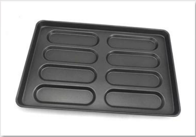
Aluminum Tart Tray