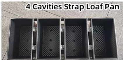
4 Cavities Strap Loaf Pan