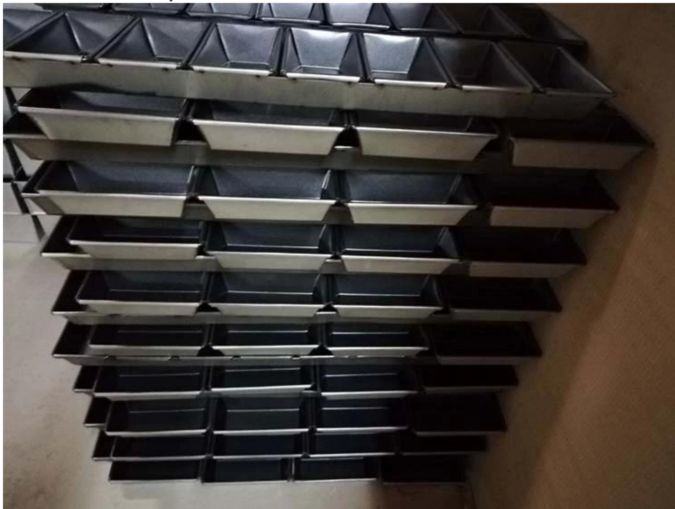
Fotos de fábrica del proveedor de sartén con tirantes