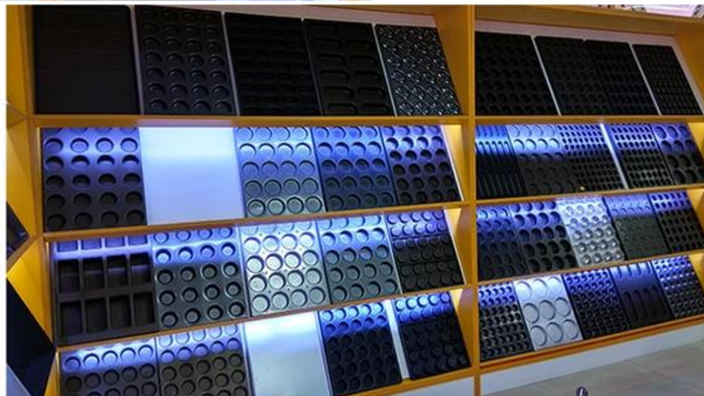
Multi-Mold Baking Tray