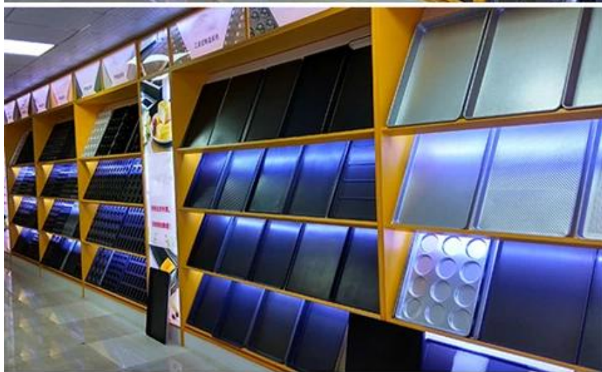
Sheet pan Drying pan