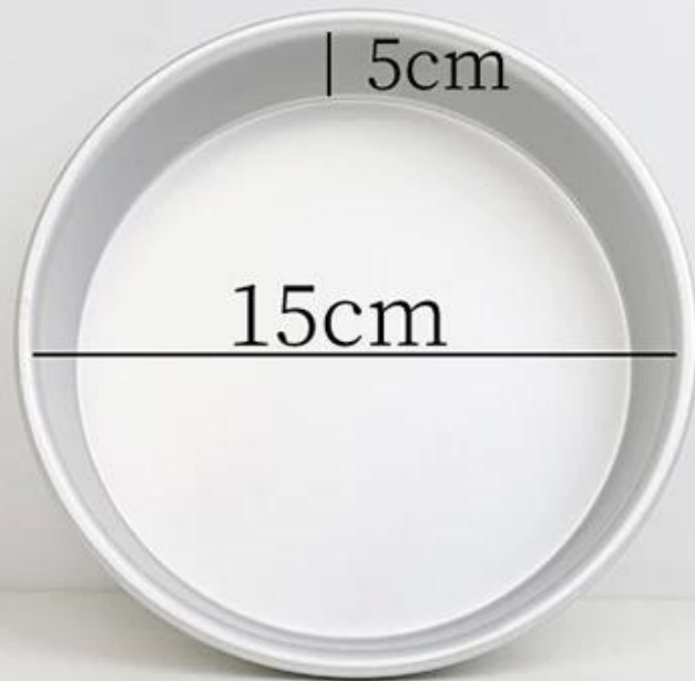
6 inch round cake mold