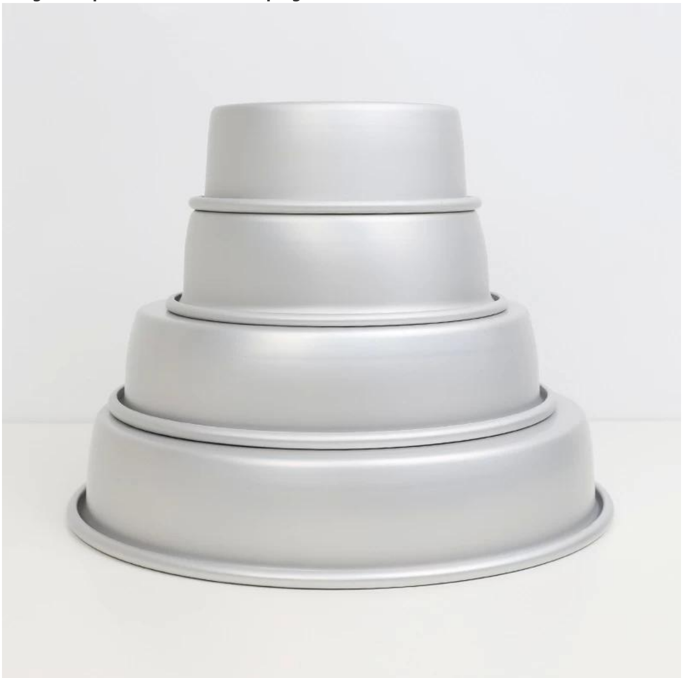
Imagen de producto de 5/6/8/10 pulgadas de aluminio.