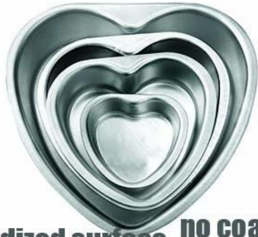
anodized surface no coating