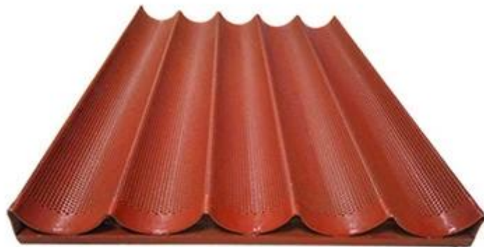
non-stick silicone coated