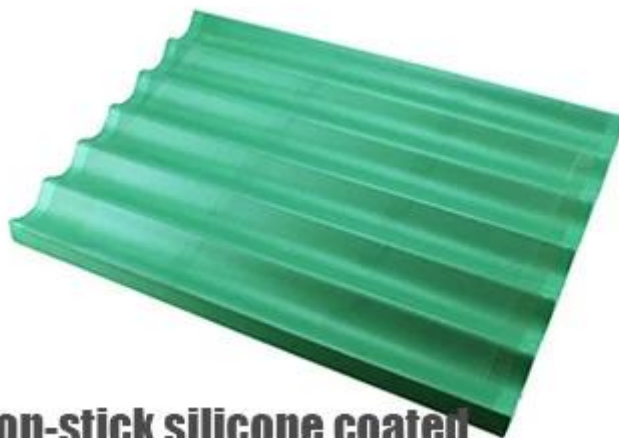
Non-stick silicone coated