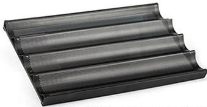
non-stick silicone coated