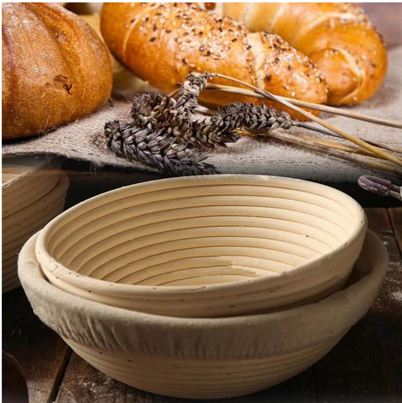
Canasta de banneton Factory imágenes