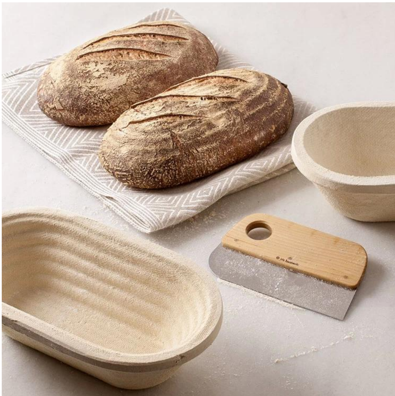
Banneton cesta fábrica imágenes