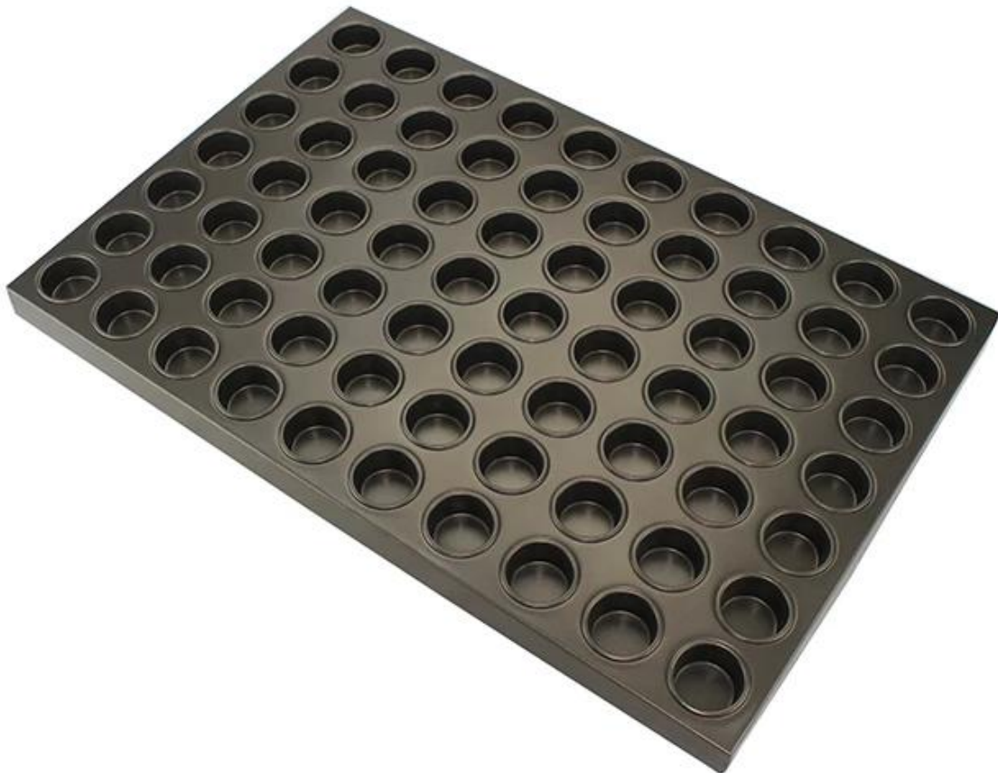
Imagen del productos de acero aluminizado mini molde redondo para hornear panecillos