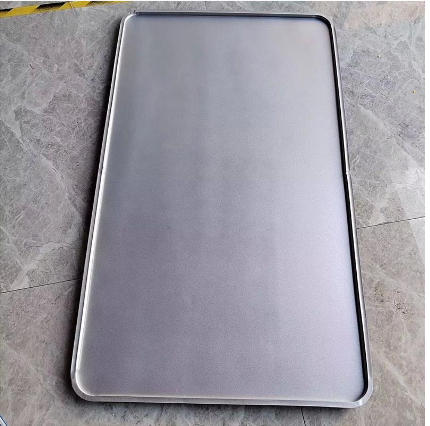
Non Stick Flat Baking Sheet (Back Side)