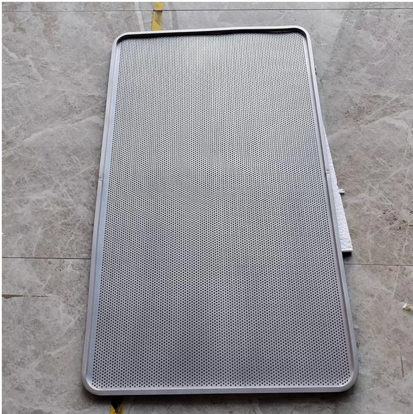
Perforated Flat Baking Sheet (Back Side)