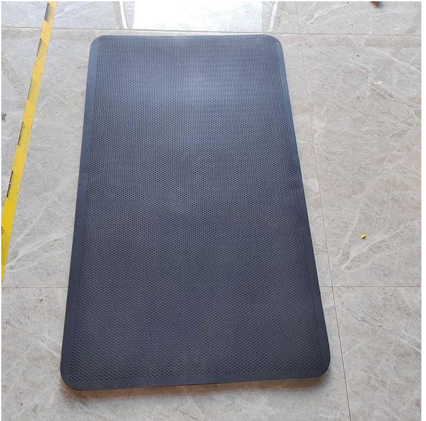
Perforated Flat Baking Sheet (Front Side)