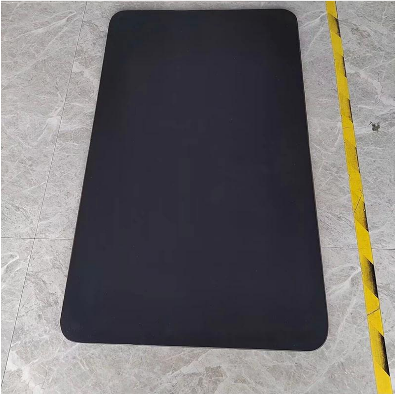
Non Stick Flat Baking Sheet (Front Side)