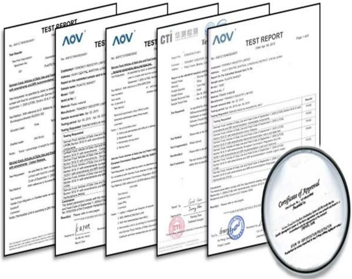
Fotos de la fábrica de bandejas para hornear personalizada y envío