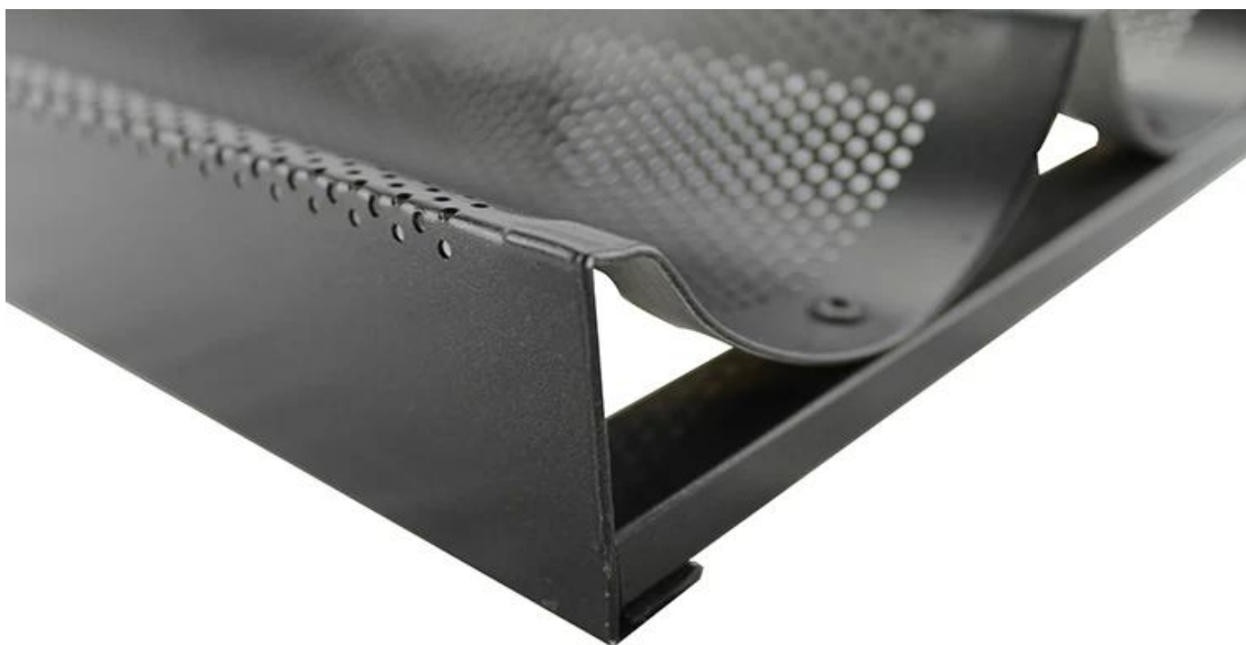
Aluminum alloy simple frame