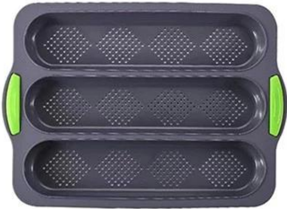
dark grey with green handle