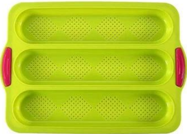
green with red handle