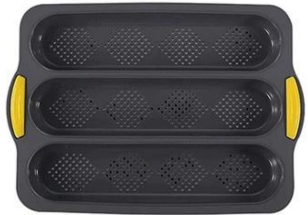
dark grey with orange handle