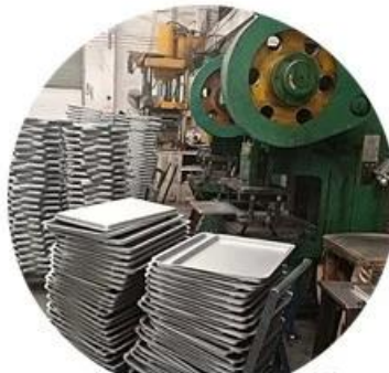
Standard production flow