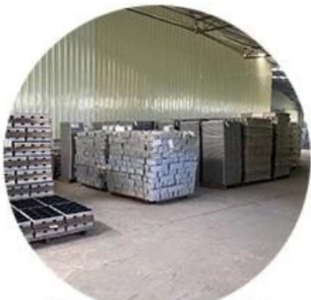
Clean & tidy warehouse