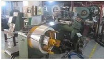
Automatic cutting machine