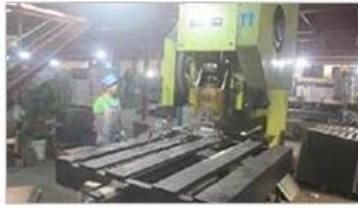
Automatic punching machine