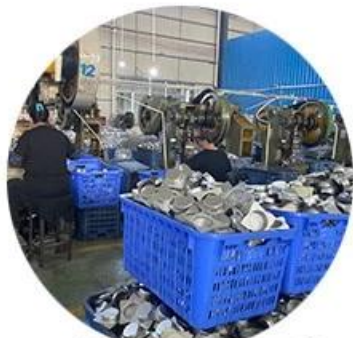
Quick production fast dispatch