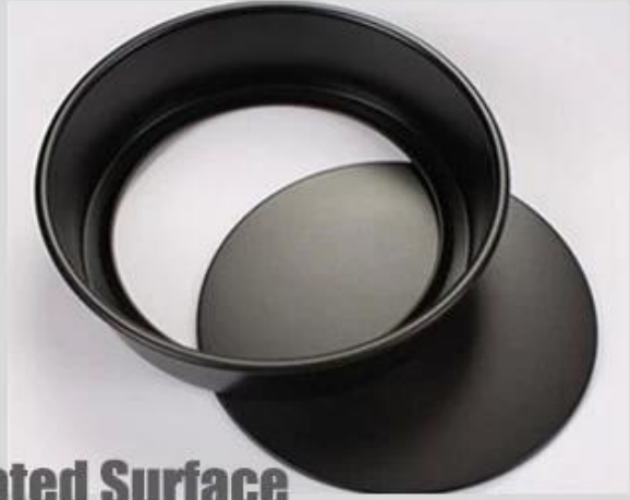
Teflon Coated Surface