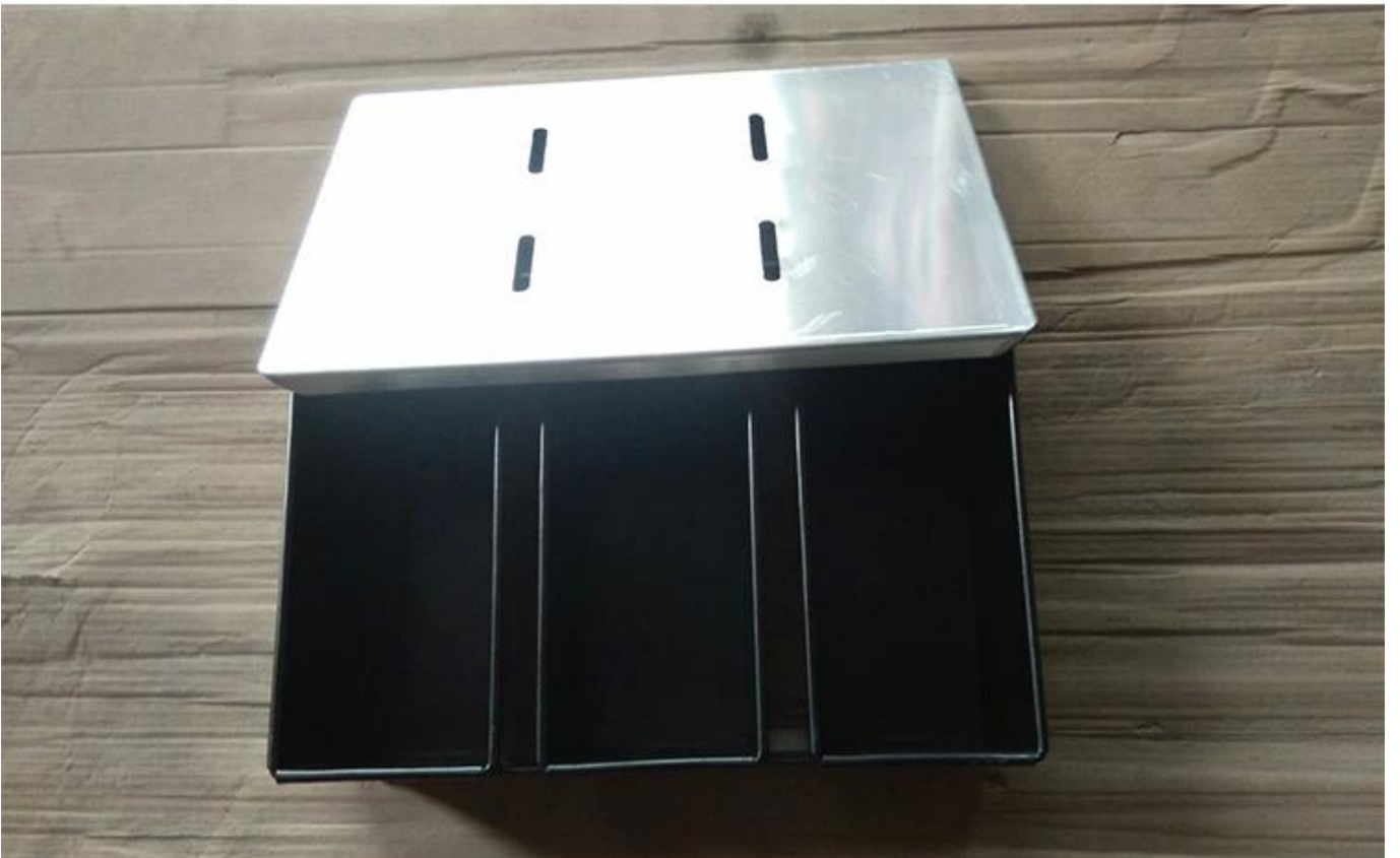
Cuadros de la fábrica