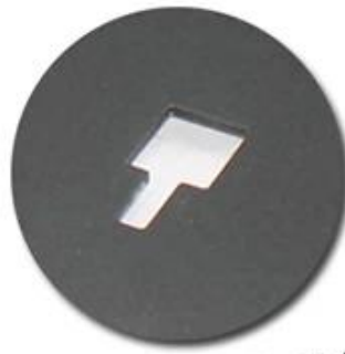
Locking buckle on the pan body and lid