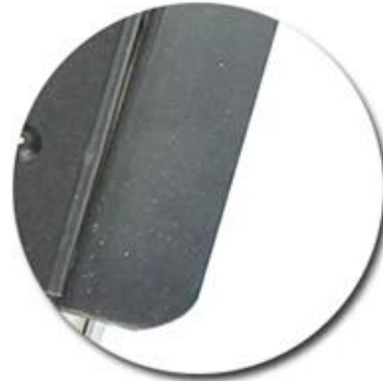
aluminized steel plate for handle

Mehr Art der Bügellaibwanne zu Ihrer Information