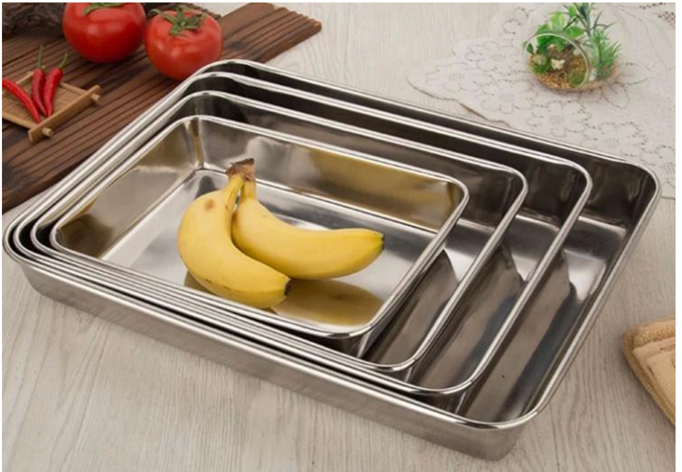
Verschiedene Blechpfannen und maßgeschneiderter Service