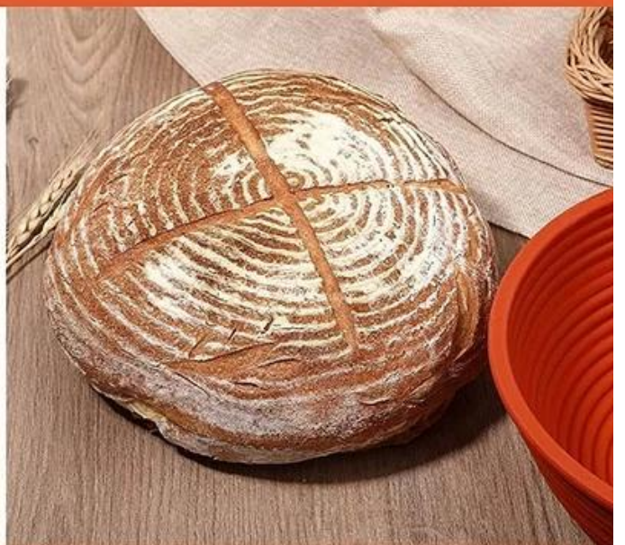
4. Bake the dough and enjoy it