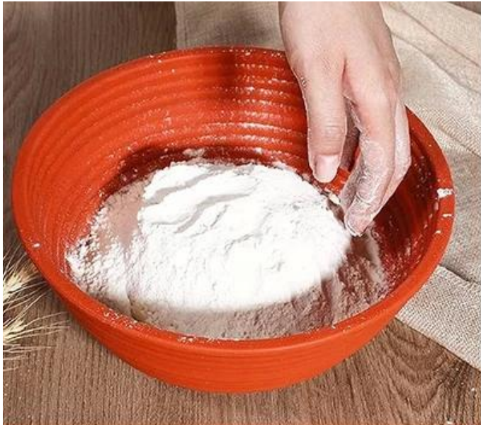
1. Sprinkle flour on the proofing basket