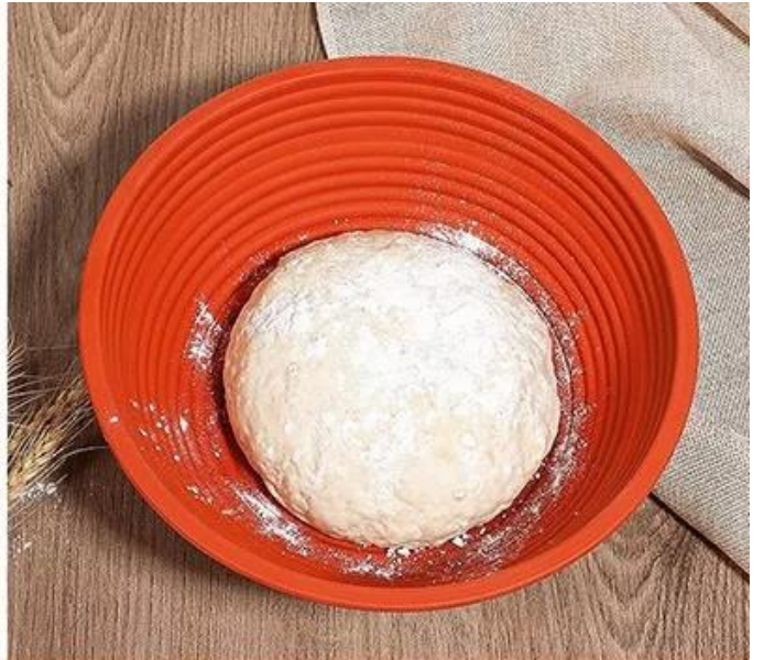
2. Place the dough in the basket