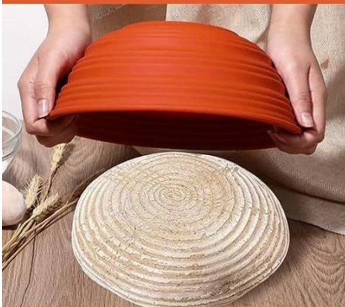
3. Take out the fermented dough