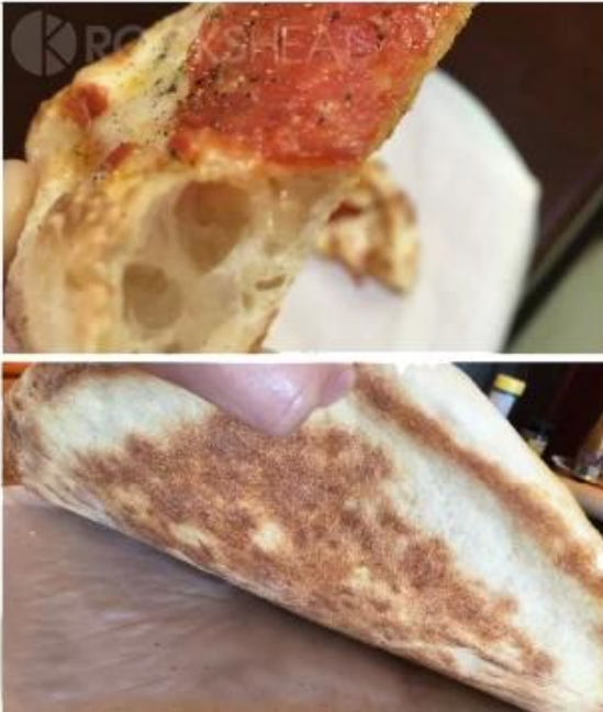
not using baking pizza stone