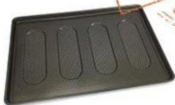
perforated & oval