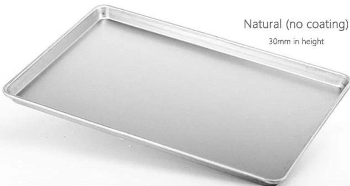
Natural (no coating)