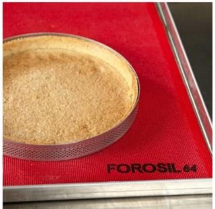
Produkte Bilder :