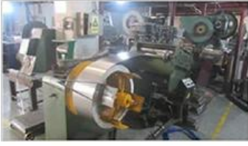
Automatic cutting machine