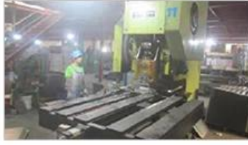
Automatic punching machine