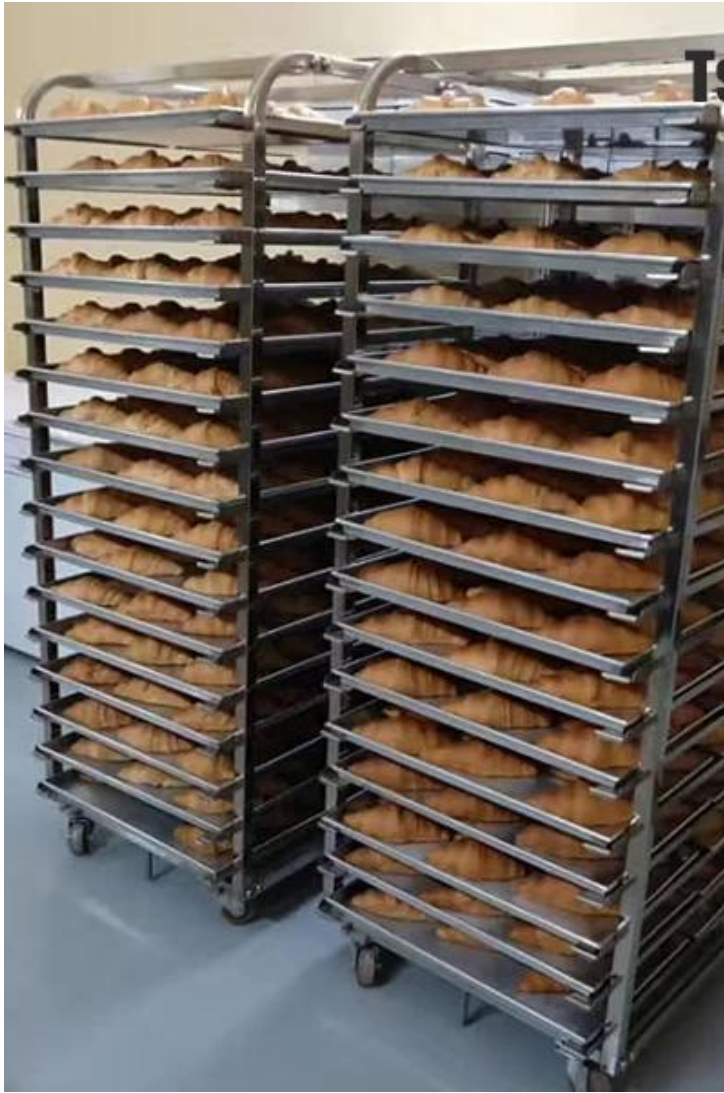
Tsingbuy Bakery Trolley custom baking pans