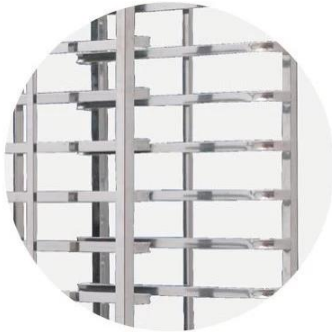
stainless steel tube material for holding trays