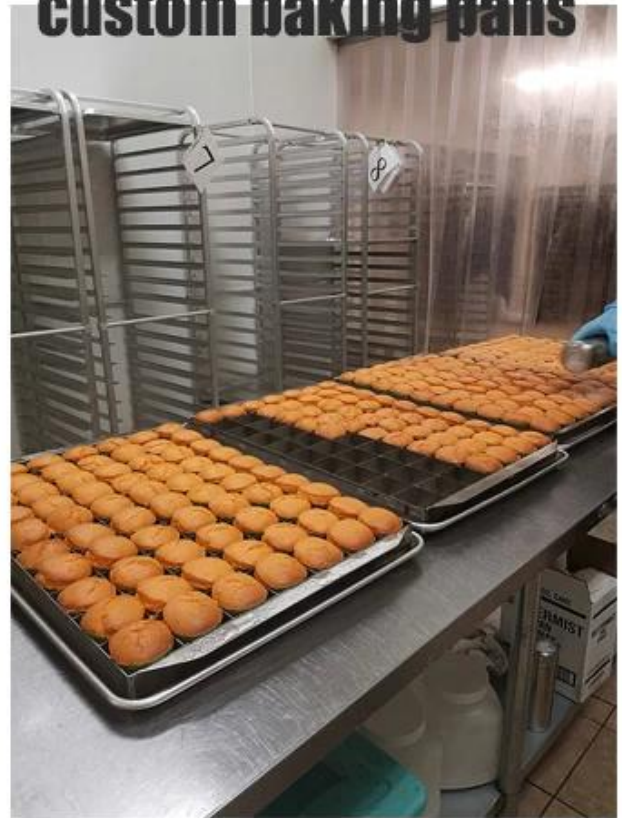
Use in Food Factory