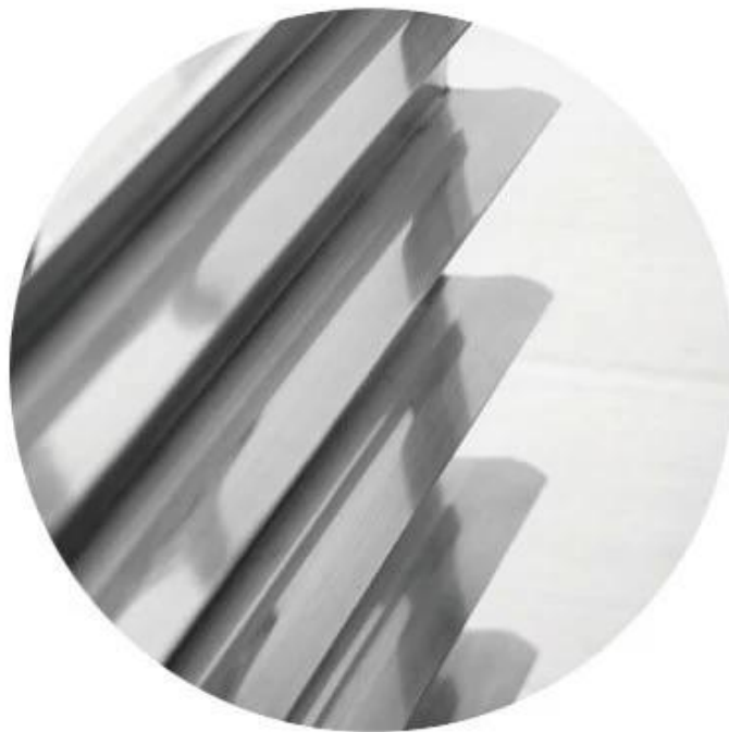
L Shaped Stainless Steel Sheet for Holding Trays