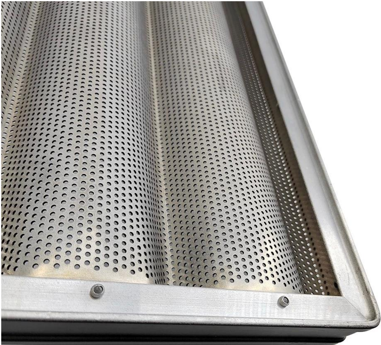
Weitere Muster von Baguettepfannen aus Aluminium für französische Laibbrote