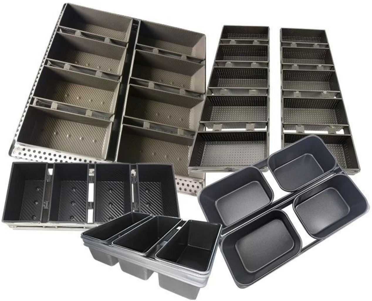
Bilder der Tsingbuy-Laib- und Brotpfannenfabrik