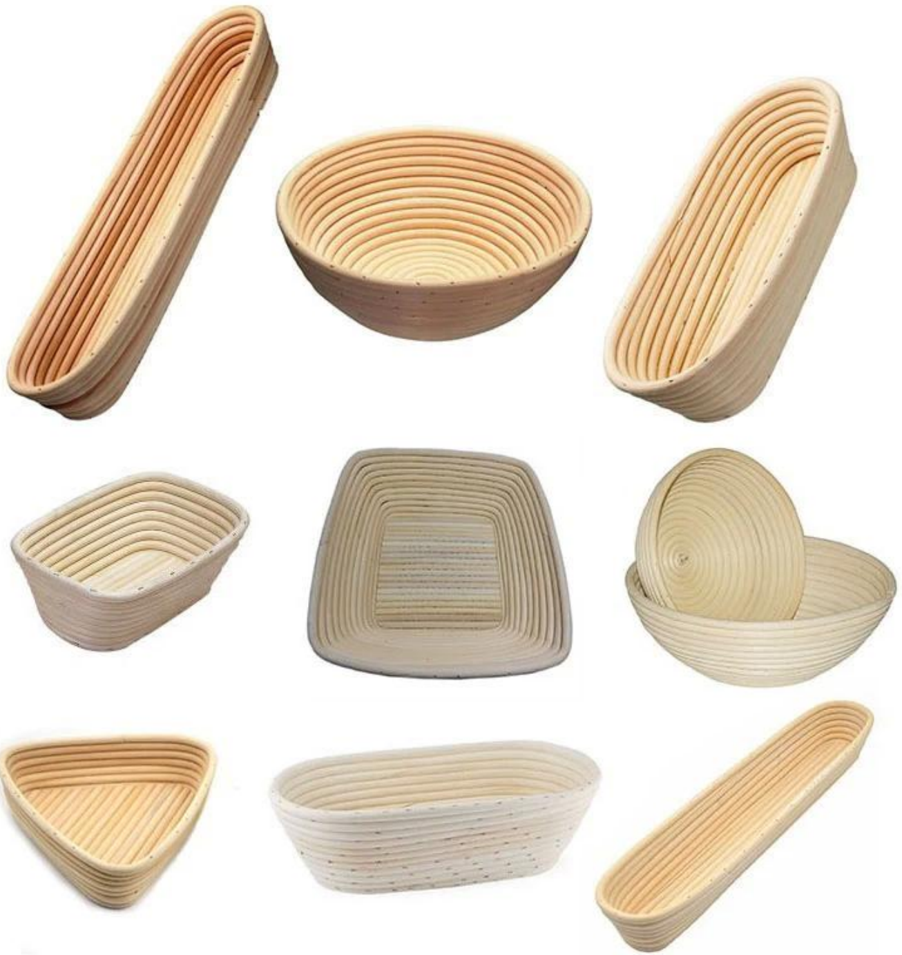
Banneton Basket Factory Abbildungen