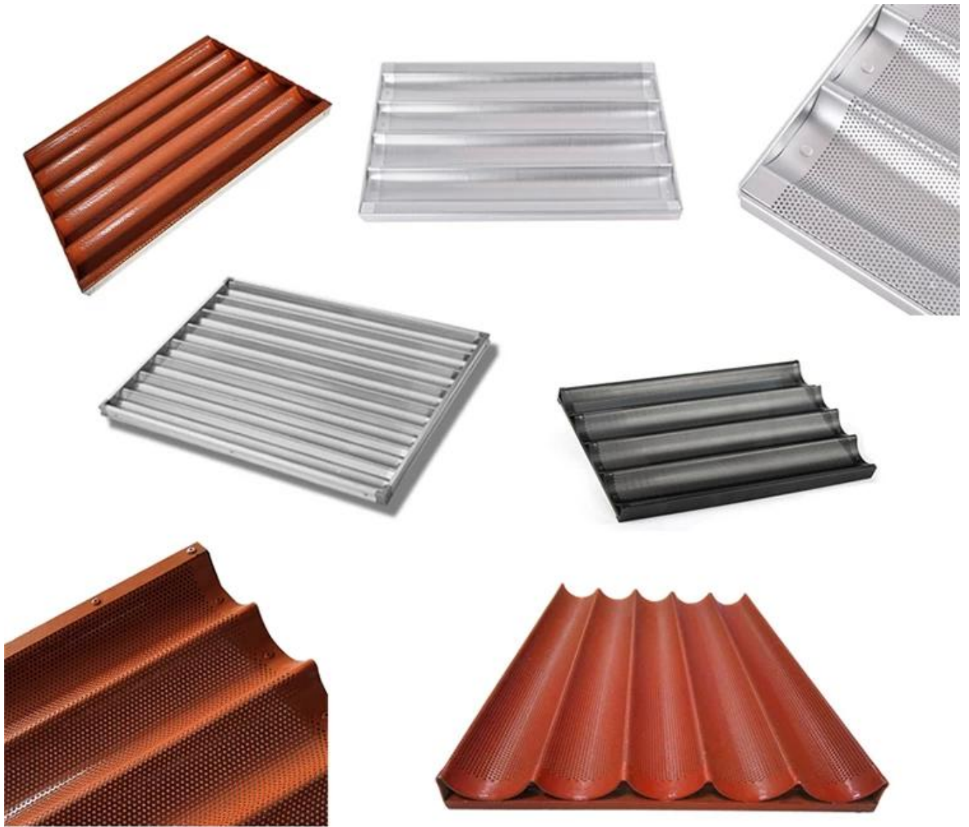
Produktionsbilder des Herstellers von Tsingbuy Baguettepfannen