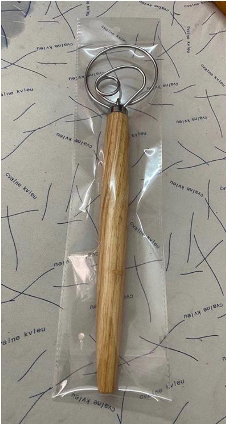
Custom Sticking label